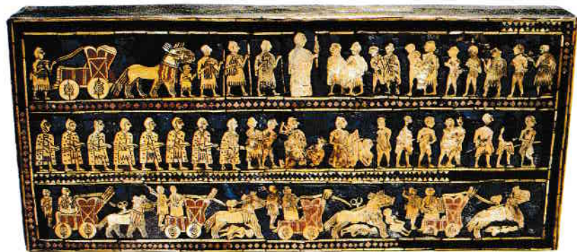
Sumer 4500-1900 î.Hr.