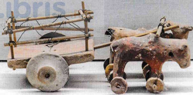
Harappa (Valea Indului) 3300-1300 î.Hr.