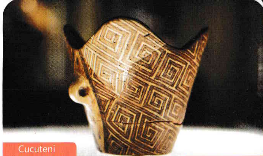
Cucuteni 5500-3000 î.Hr.