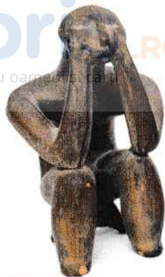
Hamangia 5200-4500 î.Hr.